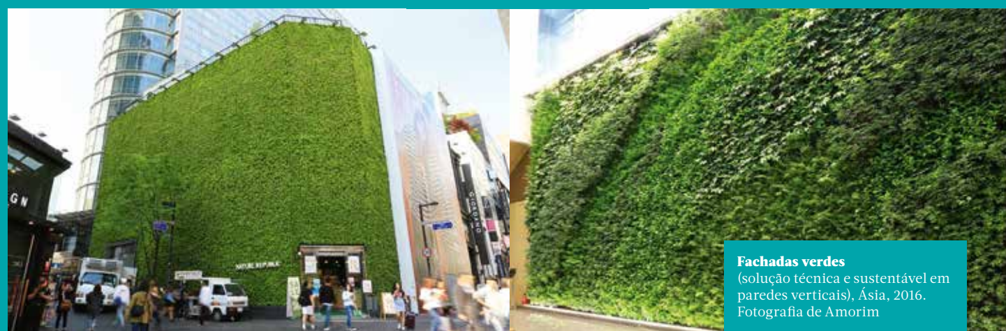
Fachadas verdes (solução técnica e sustentável em paredes verticais), Ásia, 2016.

AMORIM ISOLAMENTOS S.A. Maria Emilia Silva Rua de Meladas 105, 4535-186 Mozelos Tel: +351 227 419 100 / Fax: +351 227 419 101 esilva.aisol@amorim.com www.amorimisolamentos.com