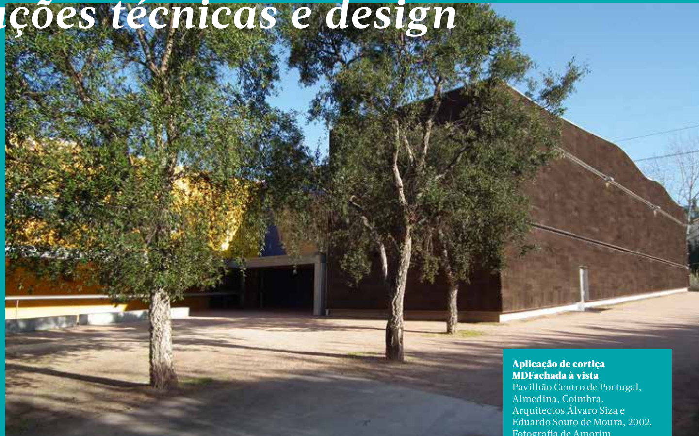
Aplicação de cortiça MDF Fachada à vista Pavilhão Centro de Portugal, Alameda, Coimbra. Arquitectos Álvaro Siza e Eduardo Souto de Moura, 2002.