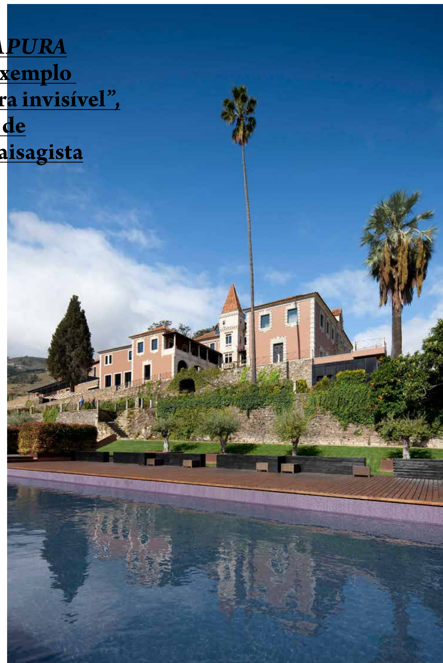
Hotel Aquapura Douro. Região Douro Internacional. Portugal. Fotografia Xavier Boymond para a Kawneer. Todos os direitos reservados.

Além do mais, os serviços do hotel que não necessitam de luz natural foram enterrados. “O resultado final permite que não se percebam as dimensões reais do edifício, até que se esteja dentro dele”, explica Luís Rebelo de Andrade, o arquitecto autor do projecto, que enquadra a sua obra dentro da denominada “arquitetura invisível”. O arquitecto também destacou o trabalho desenvolvido para criar “um diálogo entre os jardins e o hotel, de forma a que se passe de um para o outro de uma forma tranquila e natural”. Um objectivo mais do que alcançado, uma vez que o projecto foi distinguido com o Prémio Nacional de Arquitectura Paisagista pelos seus jardins verticais.