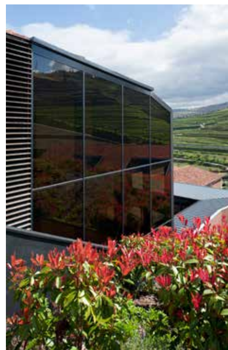
Jardins verticais embutidos no muro cortina K1202 da Kawneer. O seu desenho transparente reforça a sensação de calma e tranquilidade.

Obra: Hotel Aquapura Douro Arquitecto: Luís Rebelo de Andrade Renovação e Reconstrução de 21 apartamentos hoteleiros Superfície: 22.500m 2 PRODUTOS KAWNEER: Cristalera 1203 Muro-cortina 1202 Janelas deslizantes KASTING Janelas e portas KASSIOPÉE Portas de entrada KANADA