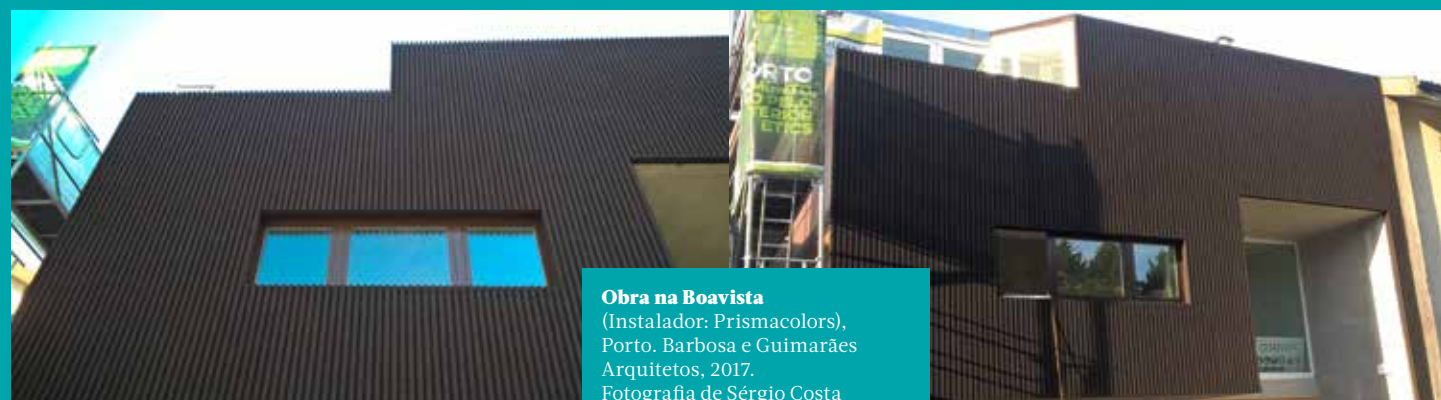
Obra na Boavista (Instalador: Prismacolors), Porto, Barbosa e Guimarães Arquitetos, 2017.