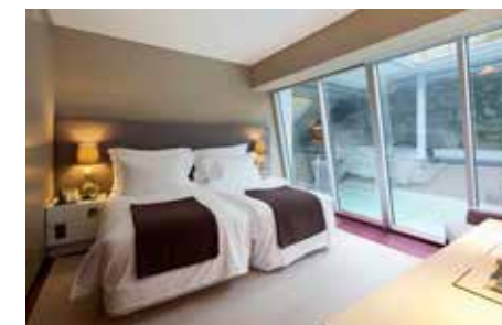
A grande variedade de janelas da Kawneer coloca à disposição dos hóspedes um sem fim de paisagens emocionantes. No interior, a decoração e o desenho identificam-se com as cores da envolvente natural que rodeia o edifício.