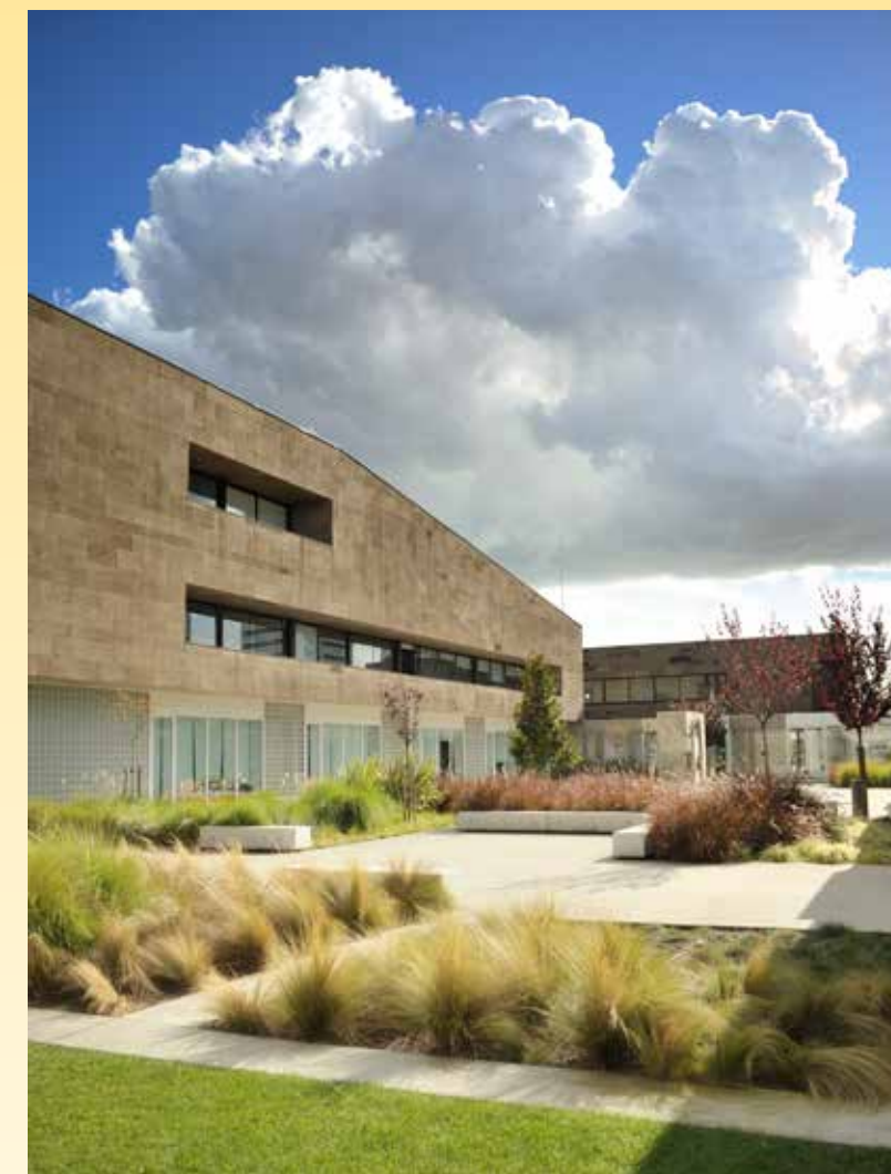
Colégio Pedro Arrupe do Grupo Alves Ribeiro, construído pela própria empresa

Constituída no final dos anos 70 a Cimpor é uma marca de referência nacional e internacional no setor da construção. Desde os finais dos anos 90, tem revelado sucessos diversos no desenvolvimento de soluções em Argamassa, tendo expandido a sua presença no mercado nacional, com a construção de duas fábricas de Argamassas Secas que lhe possibilitam responder às especificidades e tendências deste mercado.