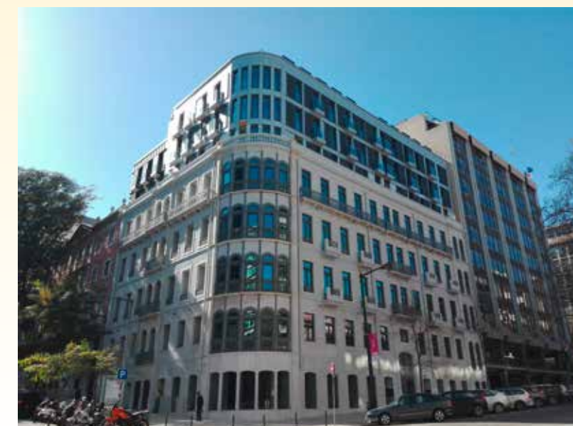
Edifício Castilho 15

O desenvolvimento contínuo de novos produtos aliado ao conhecimento e experiência adquirida junto dos seus clientes garantem um vasto leque de soluções permanentemente adaptadas à evolução verificada na construção.